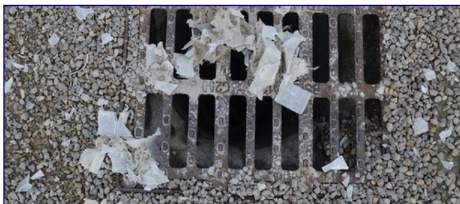
Illustration 1 : Délitement d'un parking en plastique dans la vallée du Cousin aménagée par la ville d'Avallon avec la région Bourgogne

Or, les alvéoles en plastique utilisées pour le parking - malgré nos avertissements - sont aujourd'hui en train de se déliter, constituant une source de pollution fortement néfaste pour l'environnement... peu compatible, c'est le moins qu'on puisse dire, avec l'adjectif « verte » .