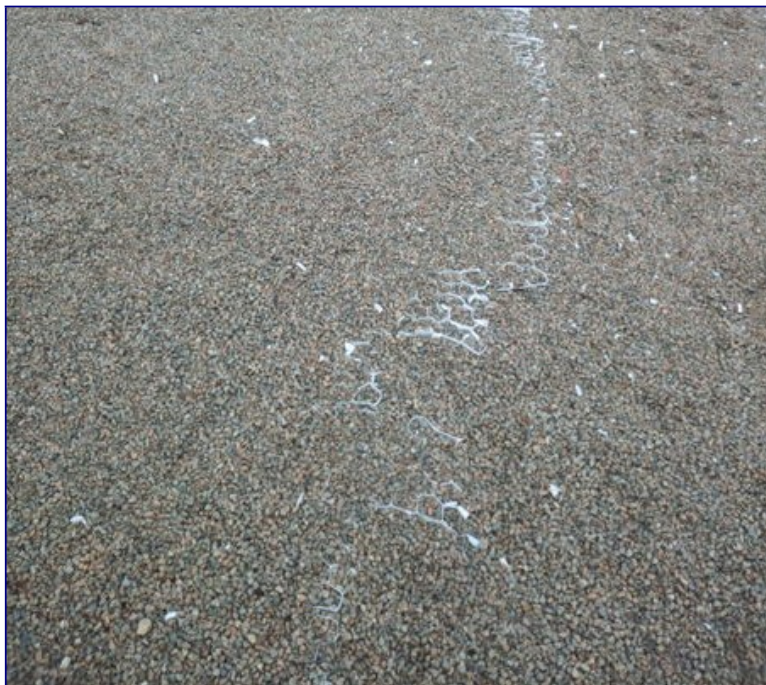
Illustration 4 : Sous les emplacements, les alvéoles, source du problème... sont toujours là !

Malheureusement, le problème reste d'actualité, car les plaques laissées sous les emplacements continuent de se dégrader... ne serait-ce qu'à cause de l'utilisation du parking.