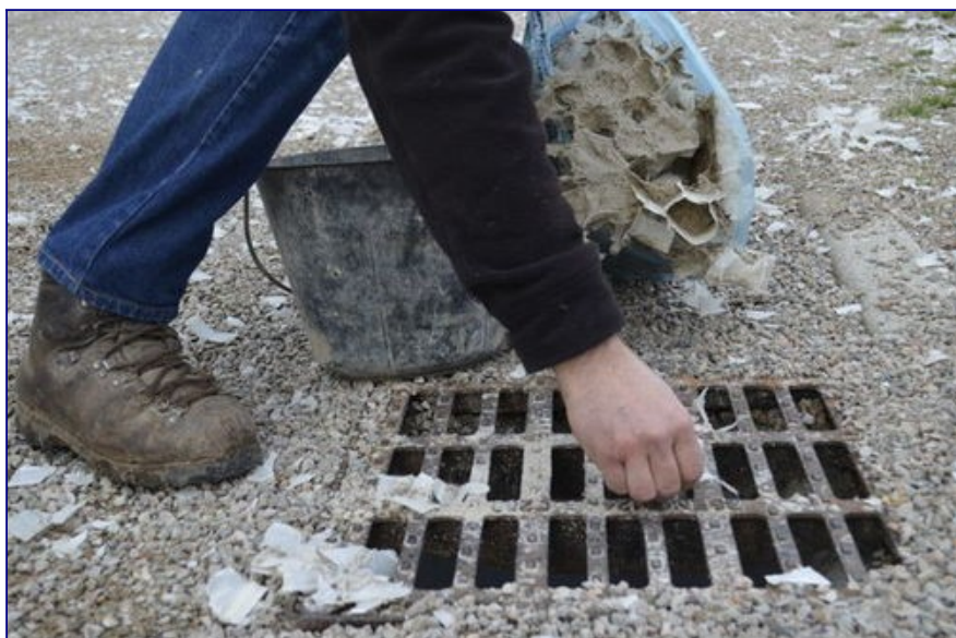
Illustration 4 : Les citoyens ont essayé de limiter les dégâts... en attendant une solution définitive