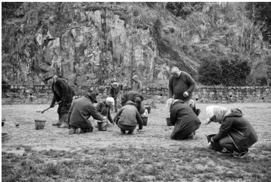
Illustration 3 : Ramassage citoyen des Cousin•es de la vallée, les 1 er et 2 janvier 2020

C'est pourquoi, Les Cousin•es de la vallée ont décidé de contribuer à l'intérêt général en organisant avec succès deux après-midi de ramassage citoyen de déchets les 1er et 2 janvier 2020 au parking de Cousin la Roche , en apportant leur "part du colibri".