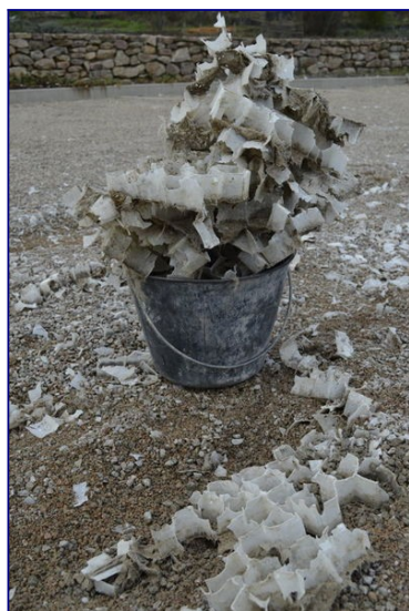
Illustration 2 : Situation dramatique au bord de la rivière du Cousin, lors de la première intervention des Cousin•es en mars 2019

Après cette photo, les ramassages citoyens de l'association Les Cousin•es de la vallée ont tenté de ramasser le plus gros. Mais les petits morceaux sont toujours là et continuent de ressortir du gravier, notamment à cause de l'utilisation du parking... Il est de notre responsabilité à tous de trouver une solution urgente à ce problème.