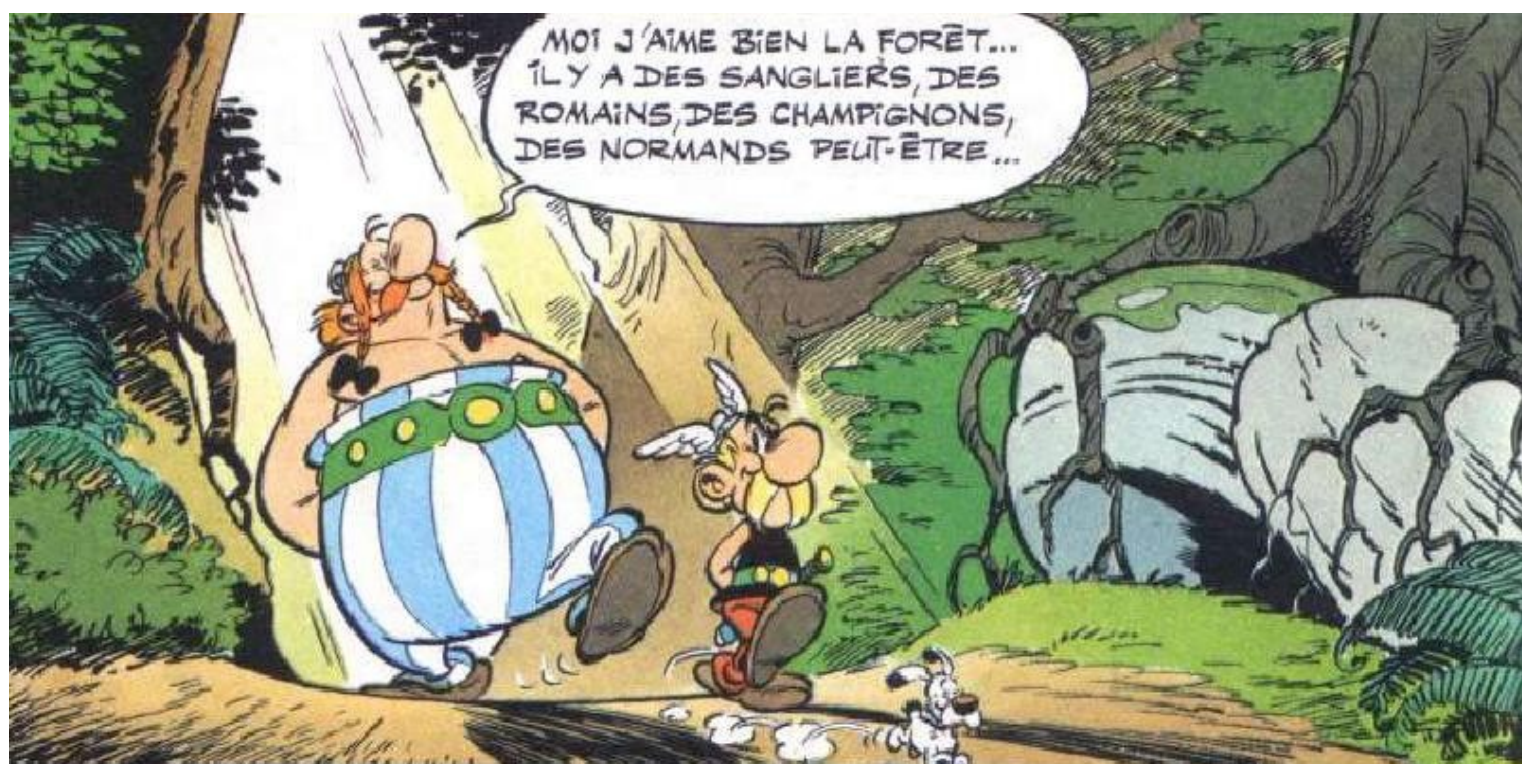
TABLE RONDE PUBLIQUE